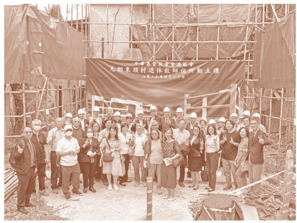
4月30日於元朗東門口地盤內舉行了「牧師退休住所工程動土禮」。

直至二零一六年，元朗東門口重建計劃作出調整，從預備作出租物業改為作本會牧師退休住所。期望為退休牧師改善居住環境，另外亦為日後重建「福堂樓」做好準備。然而與政府部門往來公函及各項程序並非如想像中簡