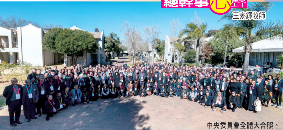
中央委員會全體大合照。