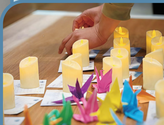
在「五道人生」卡上寫下悼念心聲，並點起燭光懷念逝去的生命。

人一生竭力追求的，原來轉瞬可以灰飛煙滅。究竟甚麼能存到永恆？對基督徒而言，這個道理我們都聽過，但真正相信並且活出來的，又有多少呢？