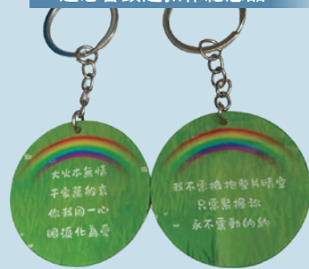
追思會鎖匙扣作紀念品

感謝神，讓我們有機會與這些受災家庭相遇；感恩能陪伴他們走過這段不易之路。感謝天父讓我看見的，不單是震驚、難過、傷痛與眼淚，更是真實的信心、信靠與順服。這樣的信心真的很難，但我真實看見了。