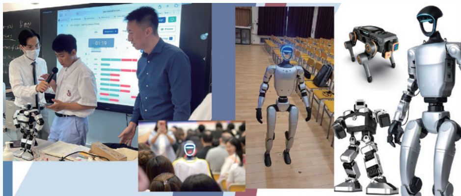
不同種類的機械人在學校中的應用。

最後，具身智能亦常常用於大型節目及慶典的表演中，最近的全運會也有機械人作為表演者，讓典禮生色不少，有些表演項目更讓機械人和人