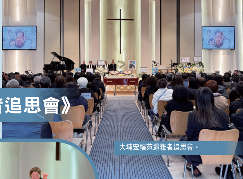
大埔宏福苑遇難者追思會。