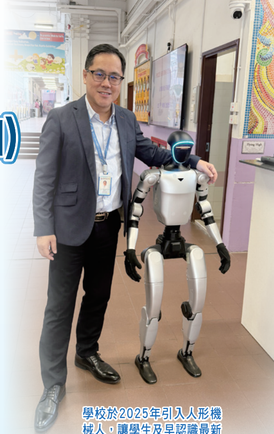
學校於2025年引入人形機械人，讓學生及早認識最新科技。

人形機械人也是具身智能的一種，載體是以人類的身體作為模仿，能夠模擬人類的動作及行為，處理日常生活的工作，事實上，以人類身體作為具身智能的載體有多方面好處，包括人類的身體能夠適應不同地形的