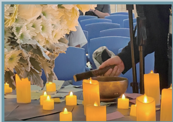
會眾逐一走到中央敲鐘