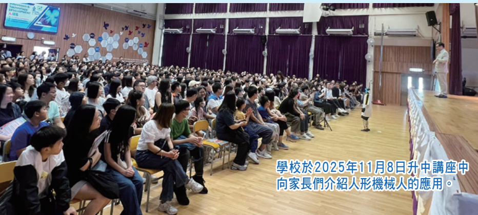
學校於2025年11月8日升中講座中向家長們介紹人形機械人的應用。

首先，引入具身智能，如人形機械人，能夠有效讓學生及早認識未來具身智能機械人的發展，了解他們的操作及應用，學懂與機械人互動，如發指令及編程，最終希望學生能夠掌握控制機械人的技術，因為未來的世