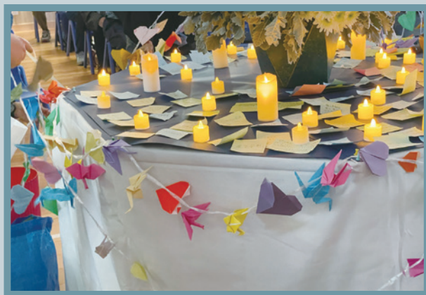
紀念儀式場地佈置