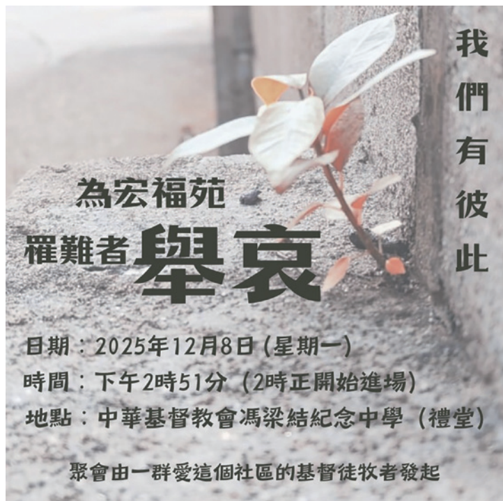
《我們有彼此》紀念儀式海報