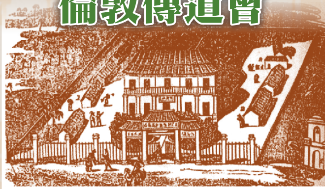
馬六甲的英華書院

倫敦傳道會（London Missionary Society，下稱倫敦會）是三個組成香港新界傳道會的基督新教組織之一。倫敦會並不是一個由個別宗派教會成立的傳道差會，而是由來自不同教會背景的基督徒攜手合作，一同組成的一個跨宗派的、要將福音傳到世界去的宣教團體。