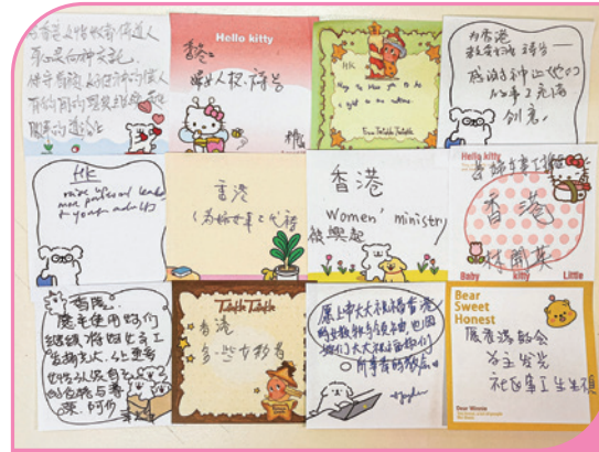
各地參加者為區會婦女事工祈禱