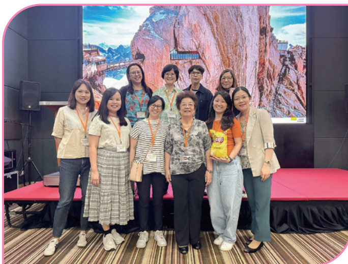
香港參加者文化之夜綵排

現代人生活繁忙，節奏急速，年輕家庭夫婦往往為生活而一起拼搏，忙碌工作。現實環境下的婦女在職場或在家庭職務負擔的不平等，她們如何在這些環境及教會各方面的事務上可以自我肯定，從而擺脫舊有的框架和枷鎖所帶來的自我貶低或罪疚感？她們在工作 and 情感上有很多壓抑，沒有出路，她們從哪裏可以得到身、心、靈的支援？她們如何自我關懷，愛自己，肯定自己的需要和感受？這些都是我接觸學生家長和年輕夫婦所遇到的問題，同時也期盼下次的婦女神學工作坊能給予姊妹們多一些實務性的思考。