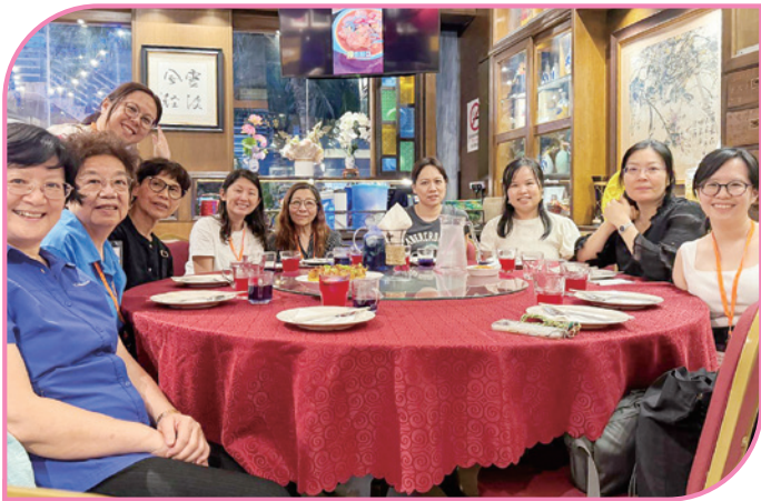
大會安排參加者品嚐地道娘惹菜