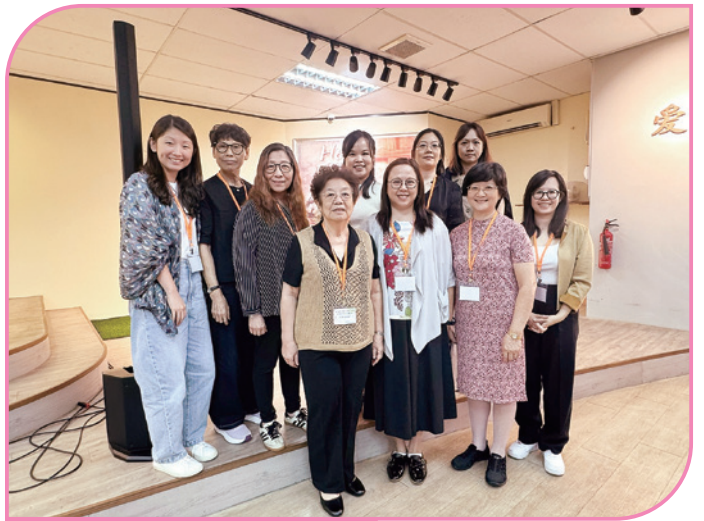
探訪基督教馬六甲長老教會

本次工作坊更令人欣喜的是，不同地區有不少新同道參與，整體氛圍也愈見年輕化。這正是交棒與承傳的契機，讓婦女神學工作坊的精神能不斷延續，並且吸引更多姊妹在主裏得着上好的福份。願這份屬靈的傳承，成為眾人生命中持續的祝福。