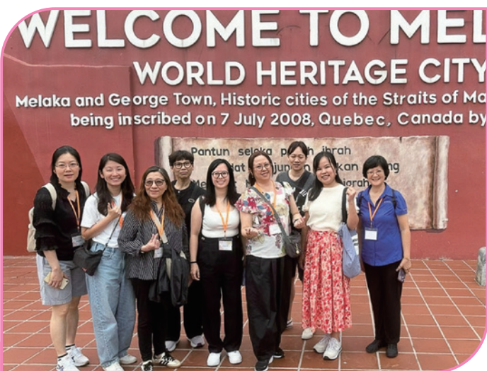
於馬六甲古城區留影

下一屆將於二零二八年舉行，由香港區會作主力籌辦，願主使我們有智慧與能力去籌備，又有足夠的資源和各方的支持，使我們能接待各地的姊妹，一同得著豐富學習與交流。誠心所願。